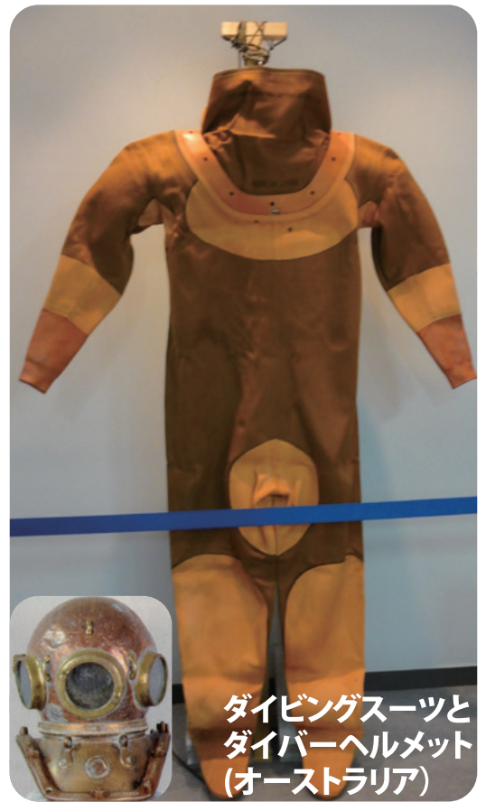
ダイビングスーツと ダイバーヘルメット (オーストラリア)