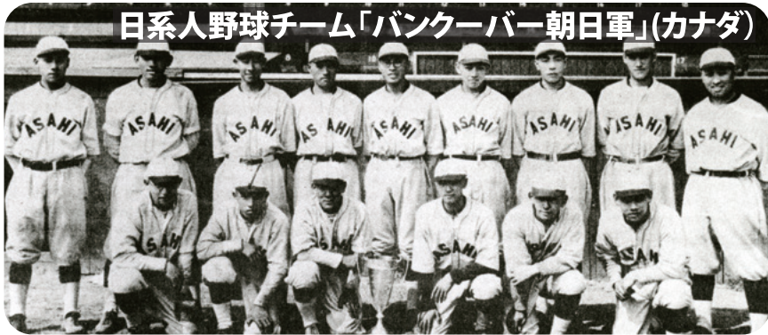
日系人野球チーム「バンクーバー朝日軍」(カナダ)