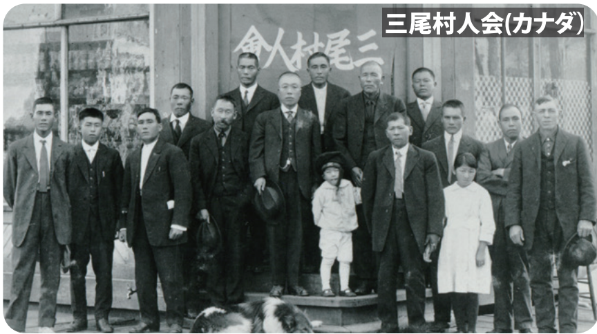
三尾村人會(カナダ)