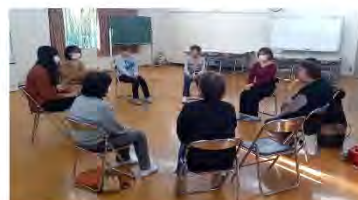
◁ヒアリング (2023年11月20日)

また、地域住民の方々の間でも住民同士のつながりが薄くなっていることを感じていらっしゃるようで、地域のリアルな現状を知ることができました。