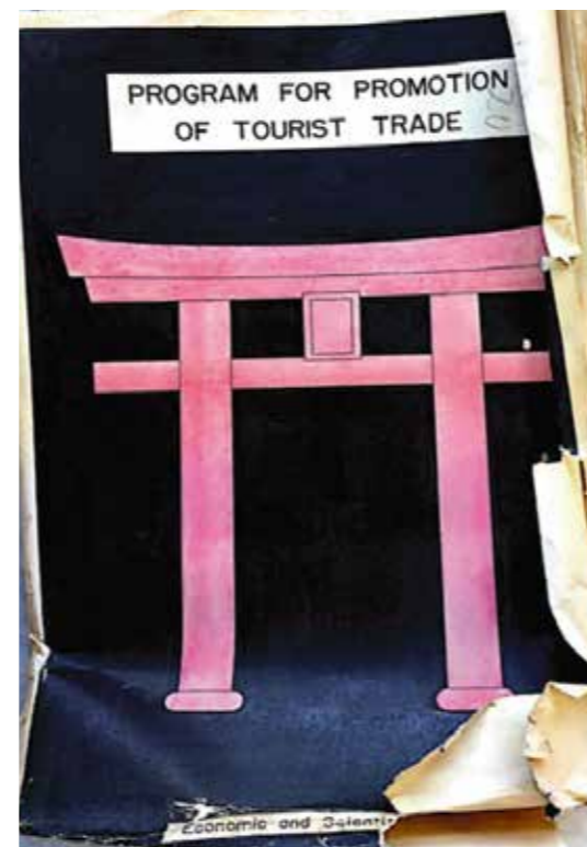
GHQ経済科学局による日本の観光振興に関するレポート“Program For Promotion of Tourist Trade”表紙、1950年発行(米国立公文書館史料 NWCTM-331-UD1787-8334)

京都の版画工房・内田美術版画肆が連合軍関係者に配布した宣伝カード(筆者所蔵)。京都駅が鉄道輸送事務所(RTO: Railway Transportation Office)として、関西電力京都支社ビルが外客・連合軍関係者向けのラクヨウ・ホテルとして用いられていた。主要な通りには市電が走っていた。