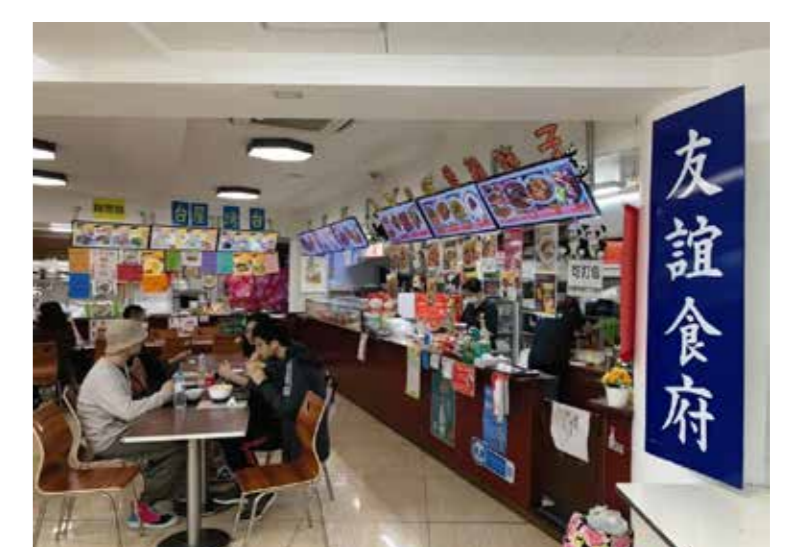
池袋西口北でのフィールドワークにて中華料理フードコート「友誼食府」