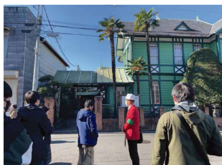
蔵造りの街並みで有名な川越市での「洋館」フィールドワーク 協力:川越市シルバー人材センター、旧山崎家別邸